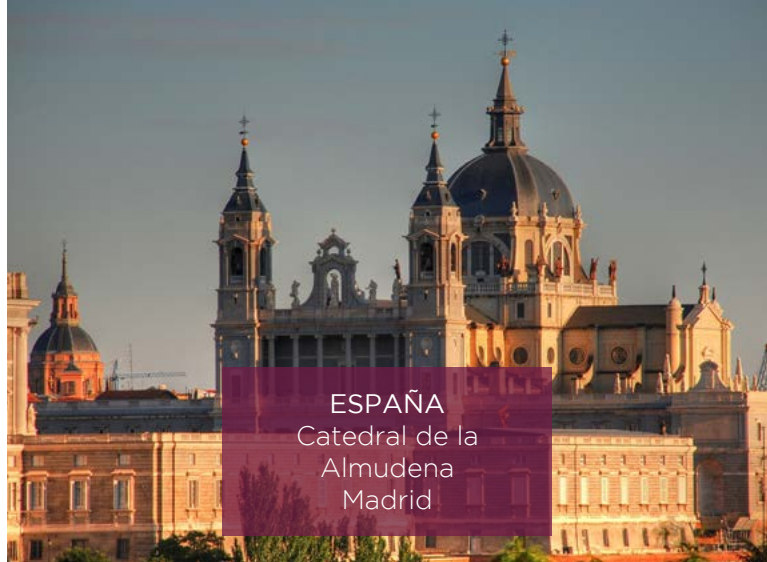
ESPAÑA Catedral de la Almudena Madrid