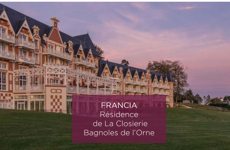
FRANCIA Résidence de La Closierie Bagnoles de l'Orne