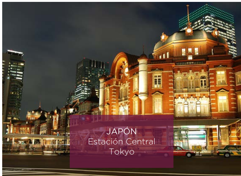
JAPÓN Estación Central Tokyo

CUPAPIZARRAS FACT SHEET Director general Eduardo Mera Canteras propias 16 Plantas transformadoras 22 Países a los que exporta Más de 60 países de los cinco continentes Web CUPAPIZARRAS.com