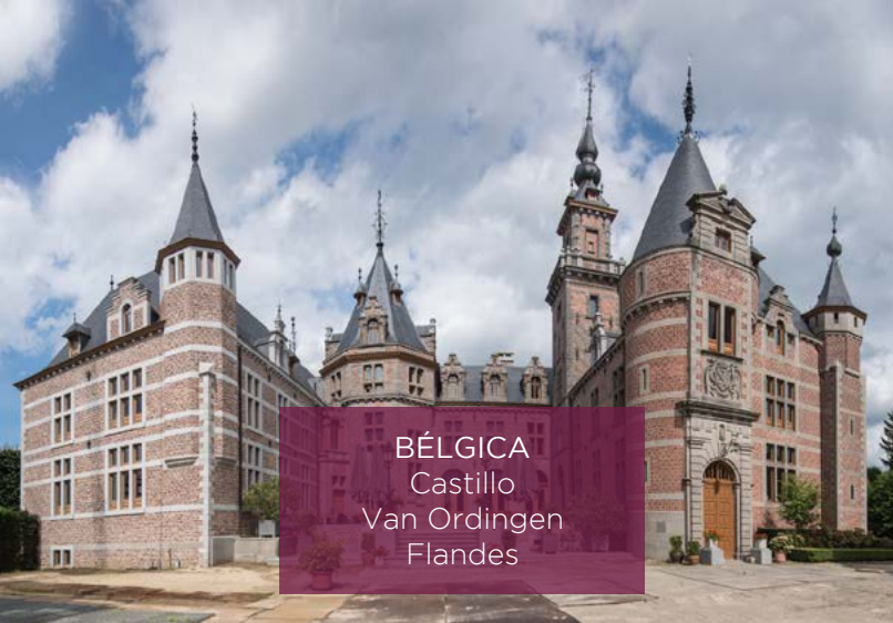
BÉLGICA Castillo Van Ordingen Flandes