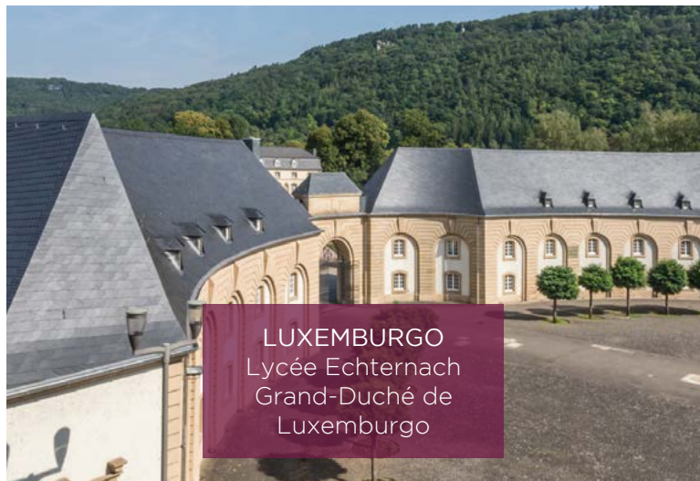
LUXEMBURGO Lycée Echternach Grand-Duché de Luxemburgo