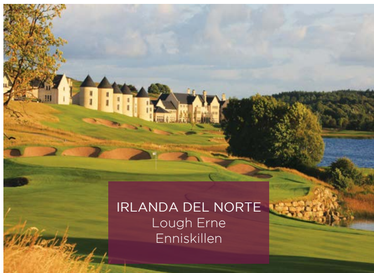
IRLANDA DEL NORTE Lough Erne Enniskillen